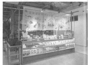
併設する DELBE ショップはアウトドア食品が豊富

また「アウトドアで食べる青空メシ」をコンセプトにしたアイビック食品（本社・札幌市）の新ブランド「DELBE」（デルベ）シ